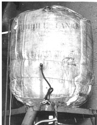
Рисунок 2 – Общий вид расширительного бака с термоизоляцией в системе высокотемпературного охлаждения ДВС [General view of the expansion tank with thermal insulation in the high-temperature cooling system of the internal combustion engine]

установлена термопара (находилась в объеме охлаждающей жидкости РБ). Общий вид этого расширительного бака представлен на рисунке 2.